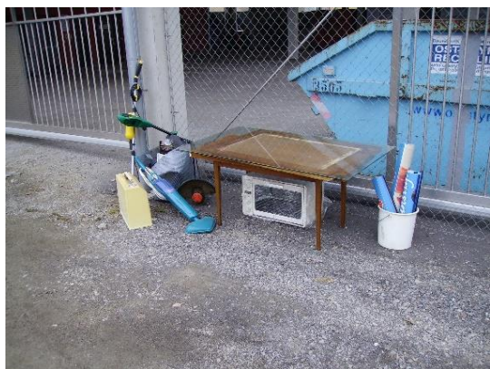
Illegale Müllablagerung vor dem ASZ ist strengstens verboten!

Des Weiteren möchten wir Sie darauf aufmerksam machen, Ihren Müll richtig und sortenrein zu entsorgen, Stichprobenartige Kontrollen zeigen, dass es permanent zu falscher Trennung von Hausmüll kommt. Sollten Sie in Ihrer Restmülltonne zu wenig Platz haben, können Sie in der Gemeinde einen Restmüllsack für 3,20 Euro kaufen, der beim nächsten Abfuhrtermin von der Firma Saubermacher mitgenommen wird.