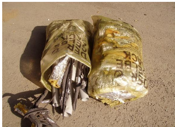
So nicht – Bitte richtig trennen!

Um die Müllgebühren weiterhin in einem akzeptablen Rahmen halten zu können, bitten wir Sie um Unterstützung!